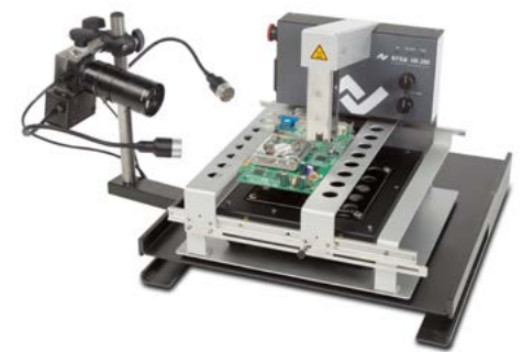
HR 200 mit IR-Untenheizung und Reflow-Prozesskamera