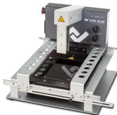
Hybrid Rework System HR 200 mit IR-Untenheizung