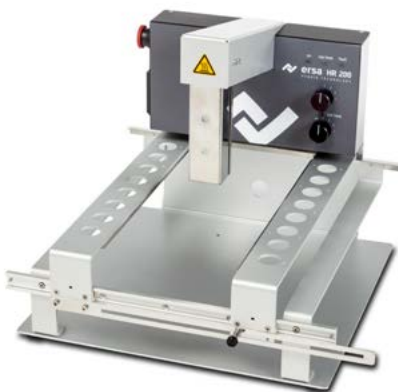
Hybrid Rework System HR 200 ohne IR-Untenheizung

tisch auf Standby zurück. Der integrierte Leiterplattenhalter positioniert die Baugruppe in optimaler Höhe zwischen den Heizungen. Zur Arbeitsplatzausstattung empfiehlt Ersa optional einen Kühlventilator sowie einen Thermoelement-Sensor und ein Temperaturmessgerät. Weiteres Zubehör bis hin zu einer Reflow-Prozesskamera, um Löt- und Entlötprozesse zu beobachten, rundet die Ausstattung ab.