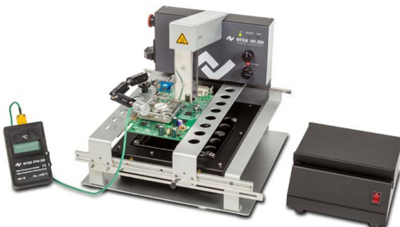
HR 200 mit Kühlventilator und Temperaturmessung – für alle Anwendungen die passende Leistungsstufe